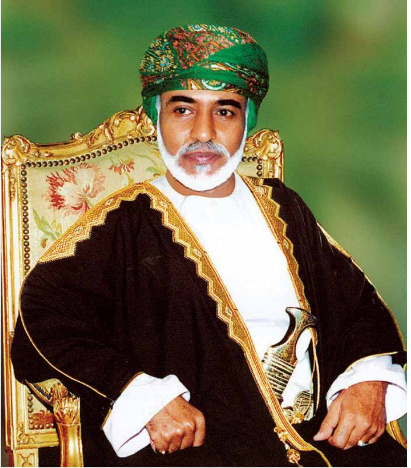
حضرة صاحب الجلالة السلطان قابوس بن سعيد المعظم