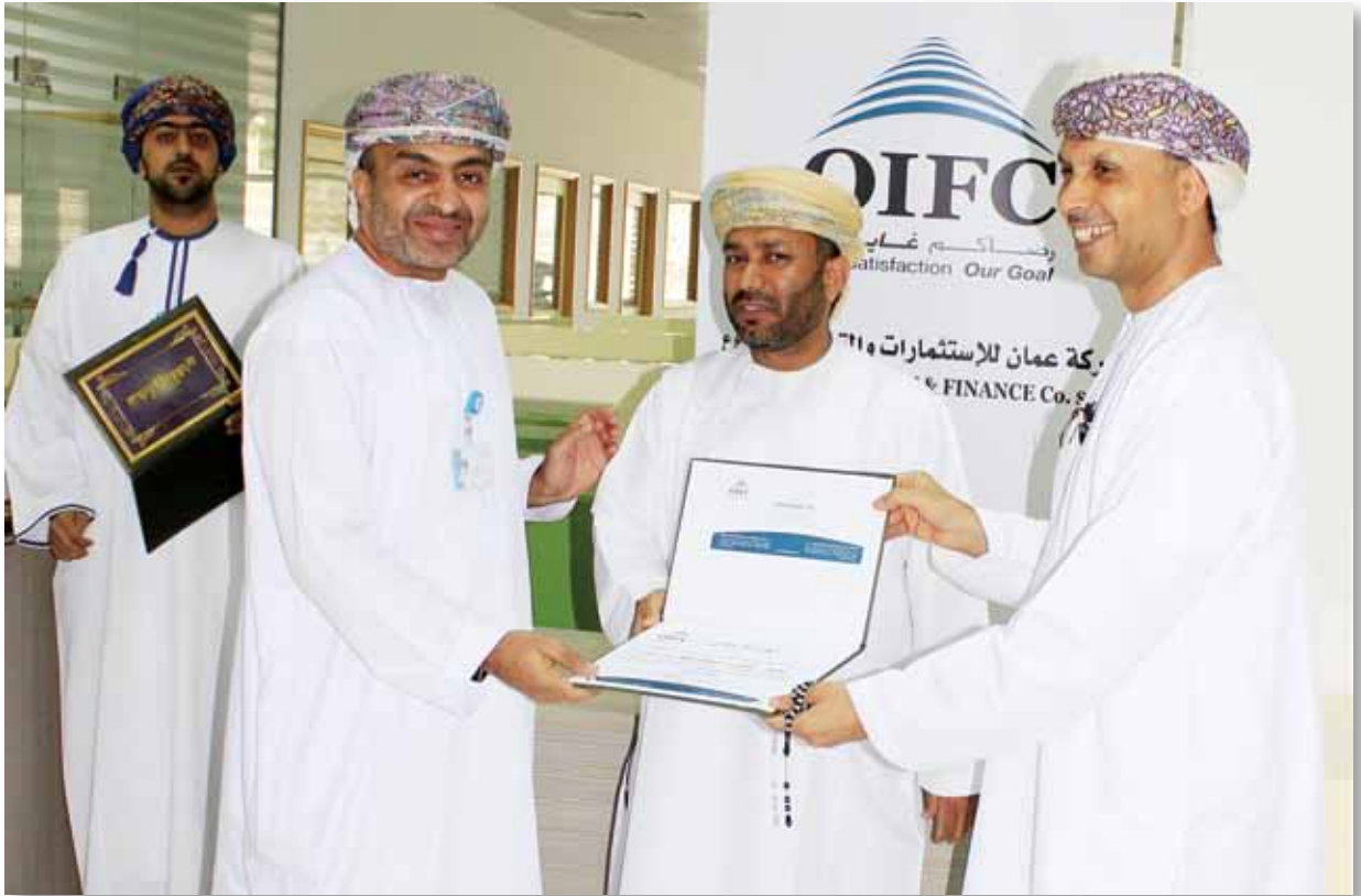
حفل تكريم الموظفين المُجدين